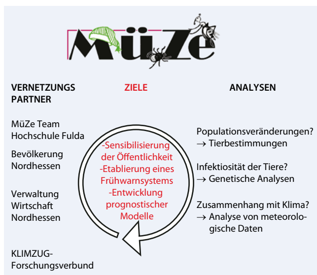
Abb. 1 ◀ MüZe: Vernetzungspartner und Ziele

Das Projekt MüZe gliedert sich jährlich in Abschnitte, die von MüZe-Mitarbeitern geplant und logistisch aufbereitet werden, sowie von KLIMZUG-inter-