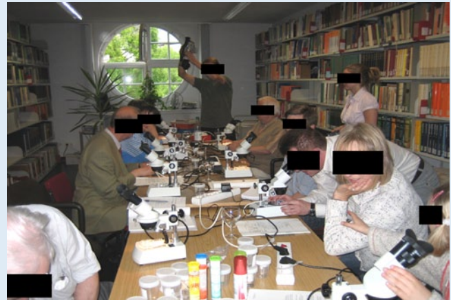
Abb. 4 ▲ Zoologische Bestimmung der Proben