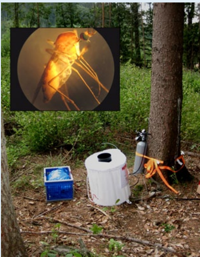
Abb. 3 ▲ Mückenfallen