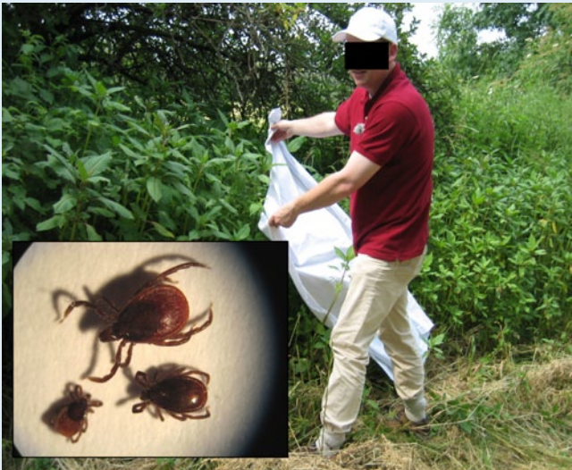
Abb. 2 ▲ Zecken